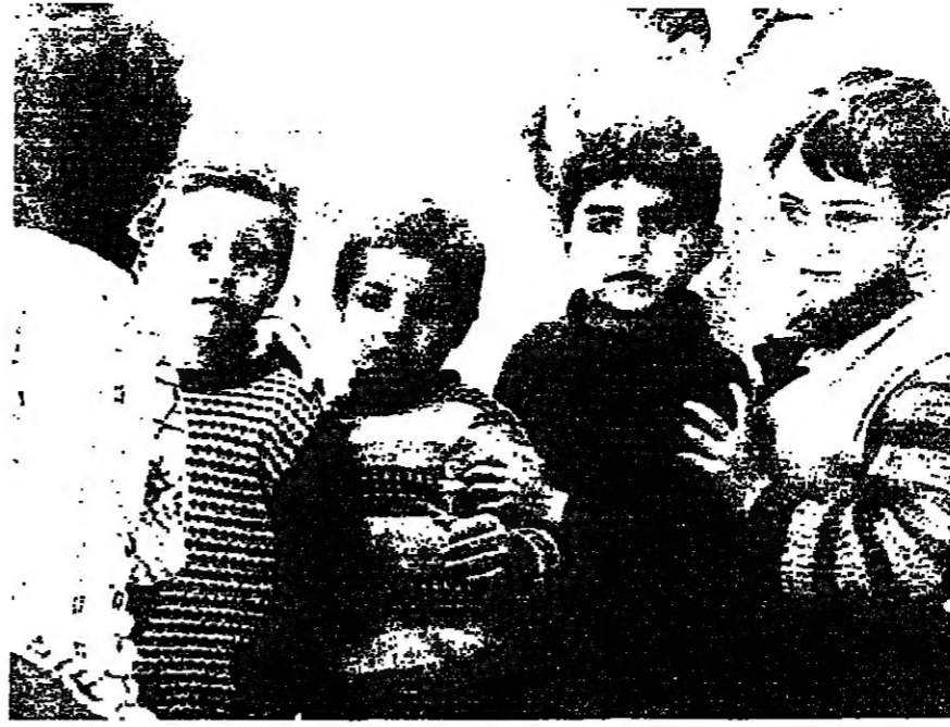
يلعبون وقد عادت اليهم الإنشاية